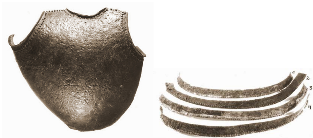
Pildil: Otepäält leitud suur rinnaplaat ja brigandiini liistakud 14. sajandi lõpust.

14. sajandi lõpul hakkasid moodsamad ammud plaatrüüdest juba läbi laskma ning vajadus uuenduste järgi viis 15. sajandiks täisplaatraudrüü väljakujunemiseni.