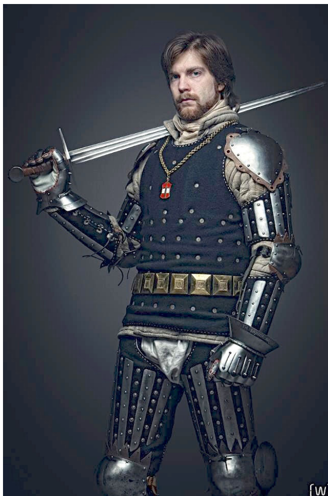
Pildil: 14. sajandi kaitserüü rekonstruktsioon.

13.-14. sajandi Euroopast pärinevaid kaitserüüsid on väga vähe säilinud. Vanade kaitserüüde metall kasutati tavaliselt ära muuks otstarbeks, seetõttu on arheoloogilised leiud väga haruldased. Vähesed olemasolevad leiud kujutavad endast vaid üksikuid kaitserüüde osi. Säilinud on ka mõningaid omaaegseid jooniseid, maale ning skulptuure. Läänemere ruumis on üks väga väärtuslik keskaegsete kaitserüüde leid, see on tulnud välja Rootsist, Visby linna külje all asuvalt kalmistult, kus 1361. aastal toimus suur lahing. Teine väga haruldane kaitserüüde komplekt on aga välja tulnud Eestist, Otepää linnuselt ning pärineb 14. sajandi lõpust.