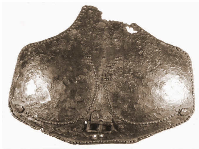
Pildil: Otepäält leitud rinna- või seljaplaat 14. sajandi keskpaigast.