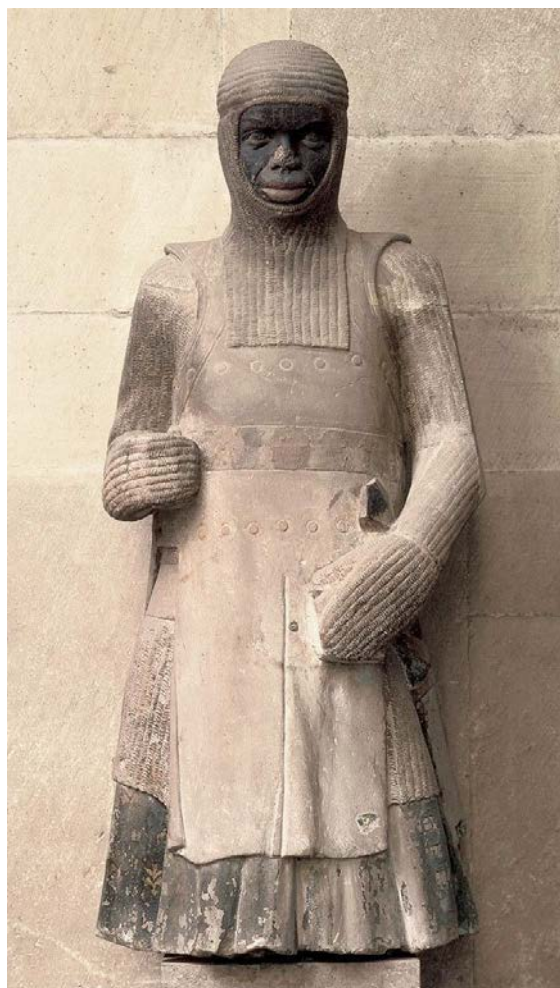
Pildil: Püha Mauritiuse kuju Magdeburgi katedraalis (13. saj).