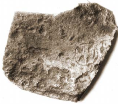
Pildil: Otepäält leitud meistrimärgiga plaadike 14. sajandi esimesest poolest.