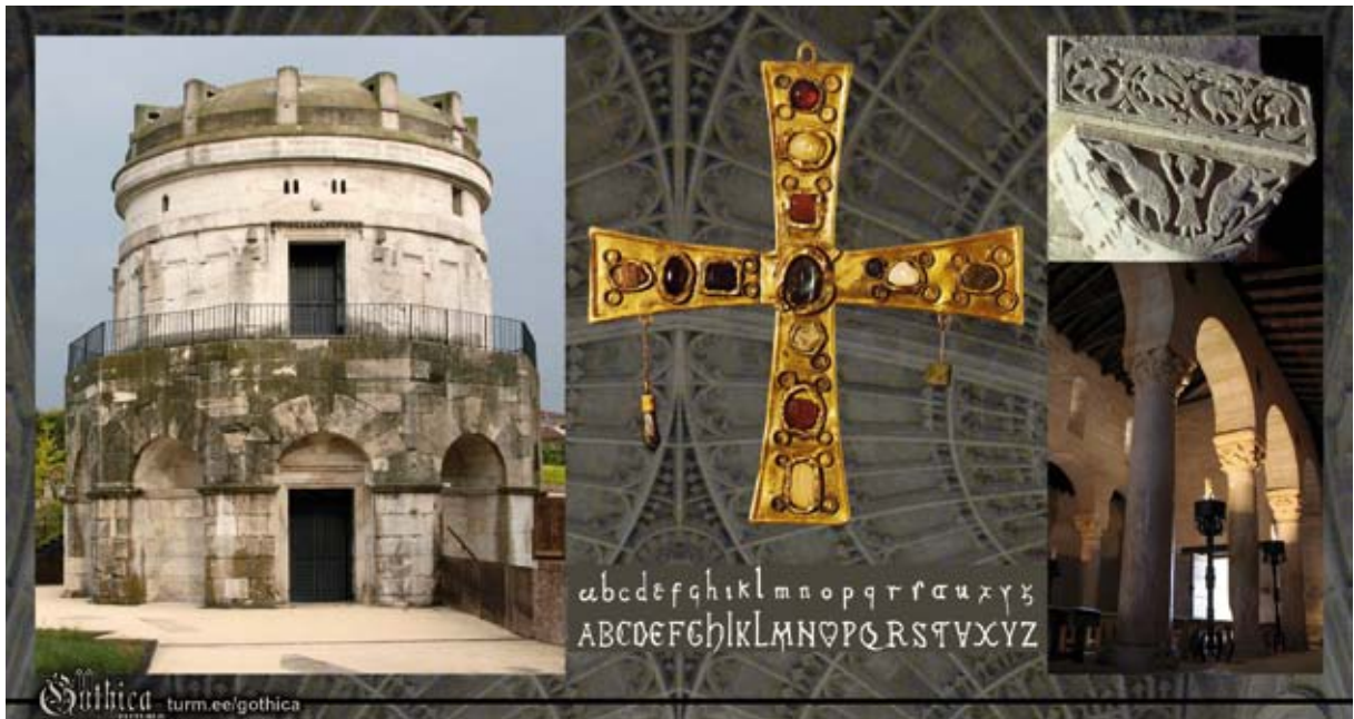
Pildil: Idagootide kuningas Theoderichi mausoleum Ravennas (6. saj), läänegootide kuldrist Guarrazari aardest (7. saj), läänegootide tähestik, arhitektuuridetailid Hispaanias asuvatest läänegootide kirikutest (7. saj).