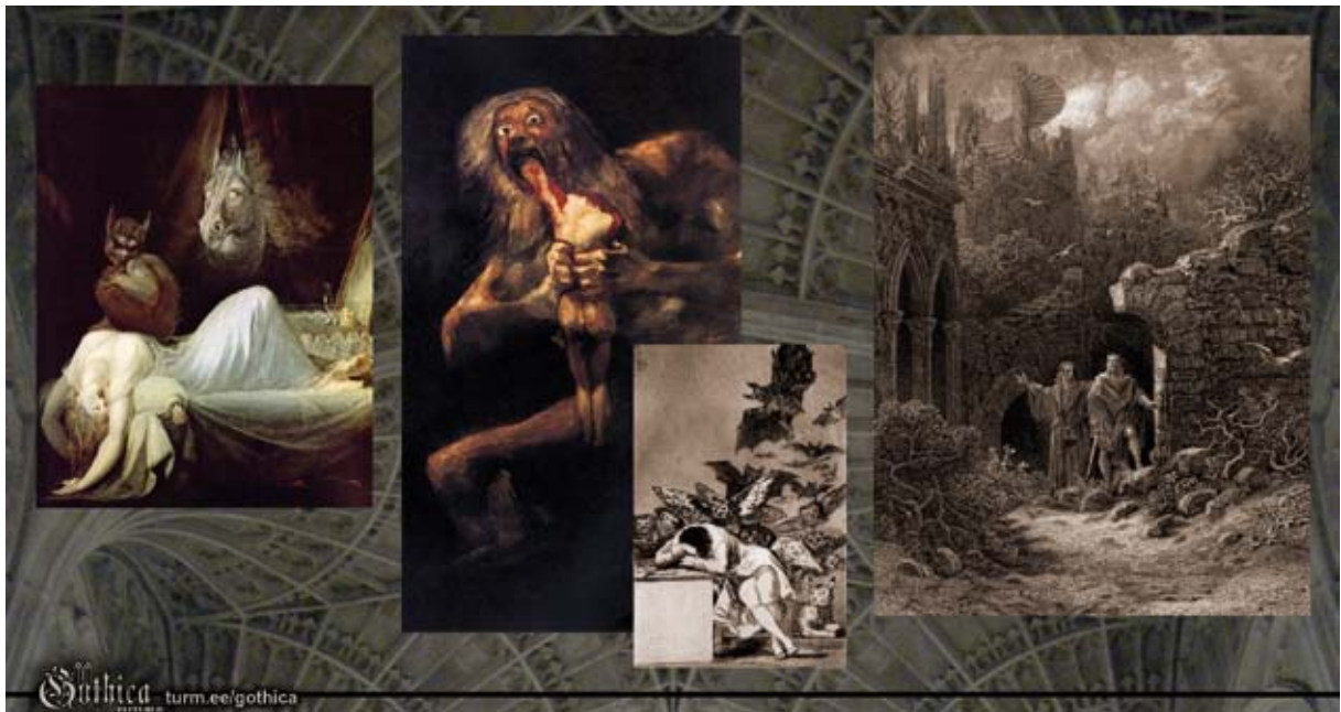
Pildil: Henry Fuseli maal „Painaja“ (1791), Francisco de Goya tööd „Saturn õgimas oma lapsi“ (1823) ja „Uinunud mõistus sünnitab koletisi“ (1798), Merlin ja Arthur Paul Gustave Doré 1868. aasta illustratsioonil.