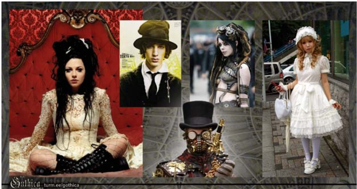
Pildil: Bändi Evanescence laulja Amy Lee, moelooja Ann Demeulemeesteri meestemood, aurupunk ja kübergootika, viktoriaanlik Lolita Jaapanist.