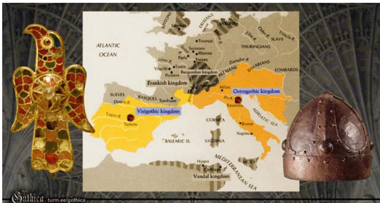
Pildil: Läänegootide fibula (6. saj), gootide kuningriigid 6. sajandi alguses, idagootide kiiver (6. saj).