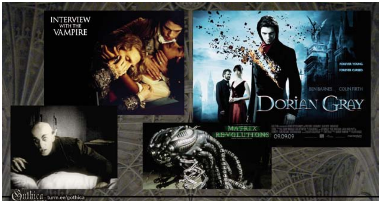
Pildil: „Nosferatu“ (1922), „Interview with the Vampire“ (1994), „The Matrix Revolutions“ (2003), „Dorian Gray“ (2009).