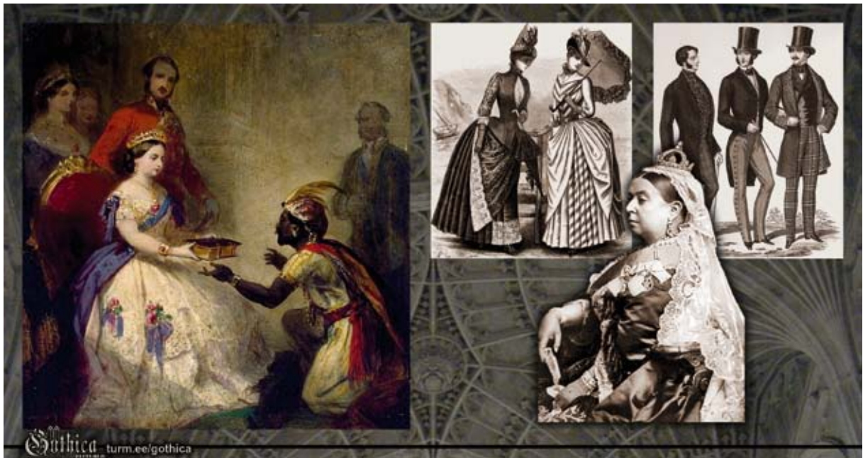
Pildil: Kuninganna Victoria ulatab piibli aafrika hõimupealikule (autor: Thomas Jones Barker 1861), 19. sajandi teise poole rõivamood ja kuninganna Victoria 1887. aasta fotol.