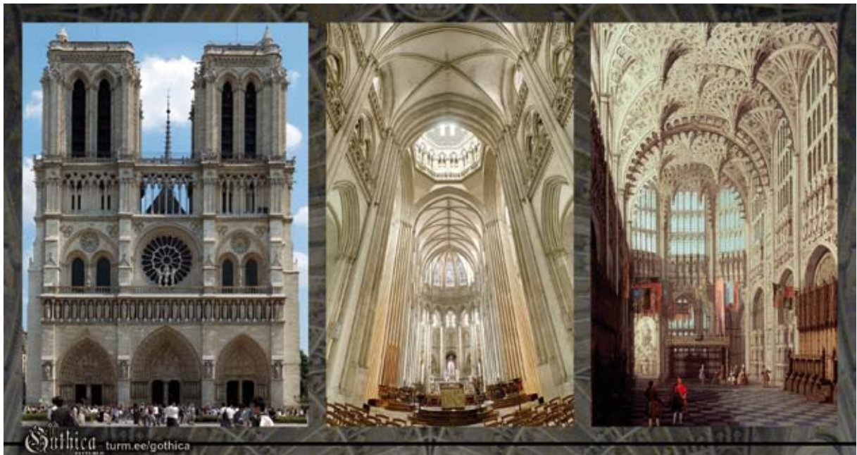
Pildil: Pariisi Jumalaema kirik (12.-13. saj), Coutances'i katedraali sisevaade (13. saj), Henry VII kabel Westminsteri kloostri Londonis (16. saj).