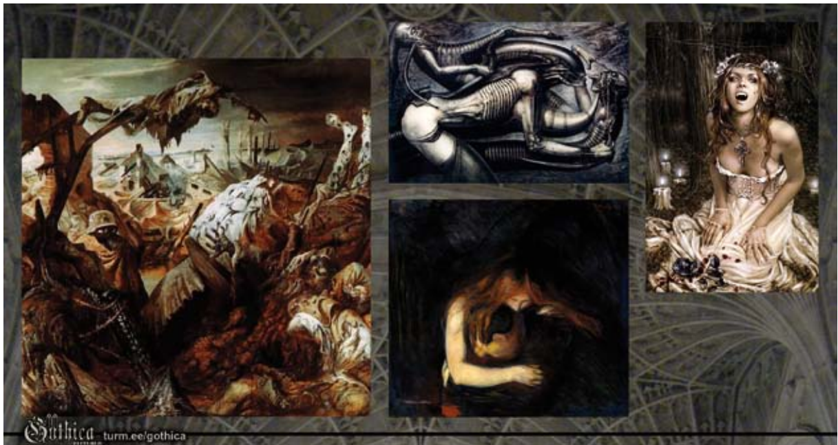
Pildil: Otto Dix „Der Krieg“ (1932), H. R. Giger „Necronomicon V“ (1977), Edvard Munch „Vampiir“ ehk „Armastus ja valu“ (1894), Victoria Francés „Favole II“ (2004).