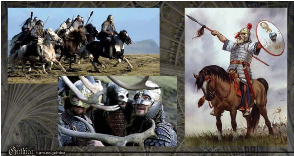
Pildil: Kaadrid filmist „Beowulf ja Grendel“ (2005), rahvasterännuaegne gooti sõdalane (autor: Angus McBride).