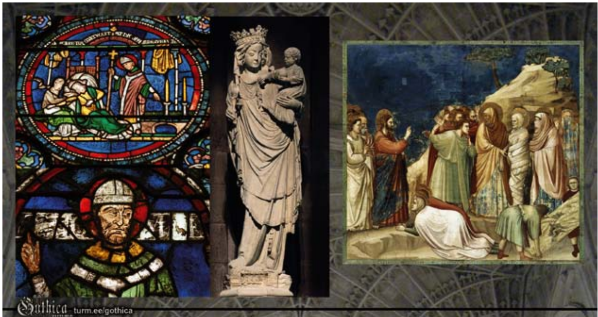
Pildil: Canterbury katedraali vitraažid (13. saj), Neitsi Maarja kuu Pariisi Jumalaema kirikust (14. saj), Giotto maal „Laatsaruse ülestõusmine“ (14. saj).