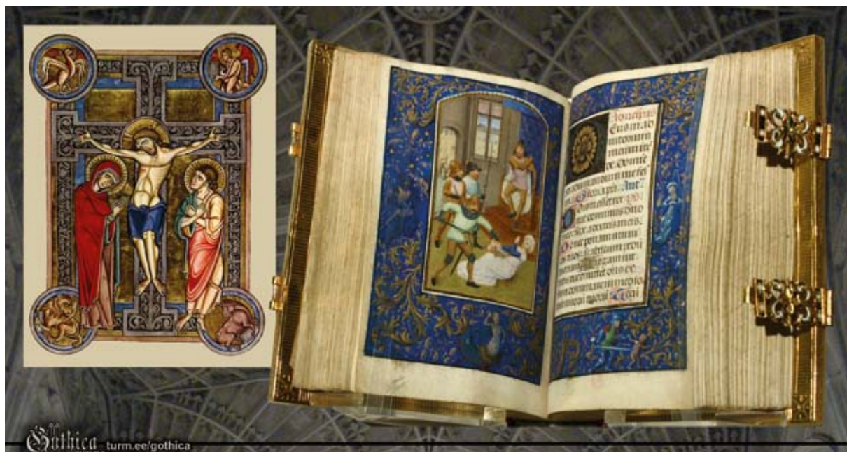
Pildil: Miniatuur 13. sajandi Saksamaalt, „Tundide raamat“ 15. sajandist.