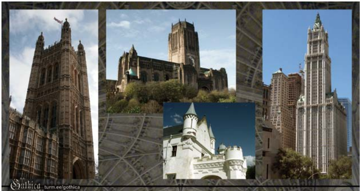
Pildil: Westminsteri palee Londonis (19.saj), Liverpooli katedraal (20.saj), detailid Alatskivi lossist (19.saj), Woolworth Building New Yorgis (20.saj).