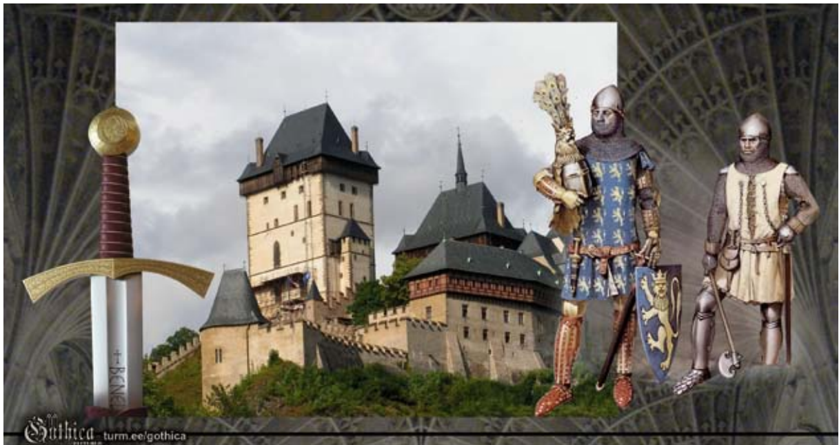
Pildil: 13. sajandi mõõk, 14. sajandi linnus, rüütel ja raskejalaväelane.