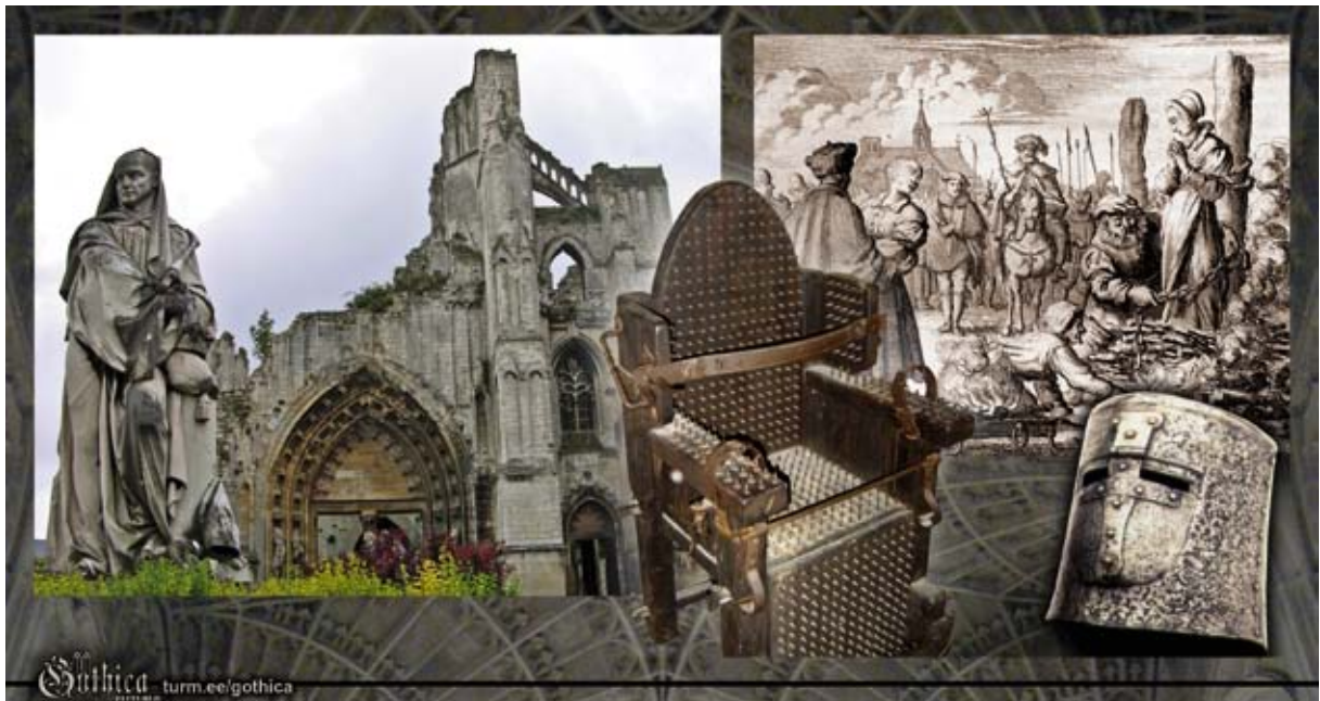
Pildil: Gooti arhitektuuristiili rajaja abt Suger' kuju St. Bertini varemetel, inkvisitsiooni piinatool ja 16. sajandi nõiaprotsess, ristsõdija kiiver 12. sajandist.