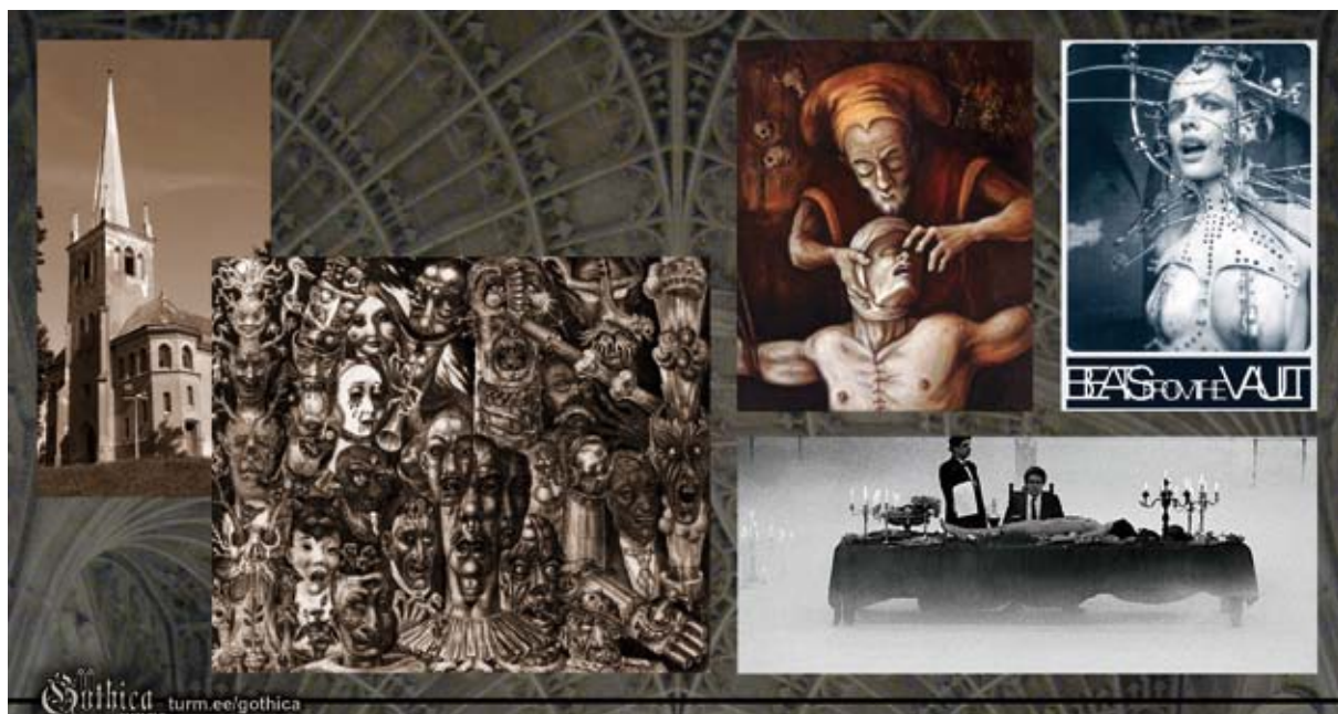
Pildid: Rõngu Mihkli kirik (1901), Eduard Wiiralt „Põrgu“ (1932), Priit Pajos „Surnuärataja“ (2006), kaader Veiko Õunpuu filmist ”Püha Tõnu kiusamine” (2009), detail industriaalmuusika peo „Beats From The Vault“ plakatil (2011).