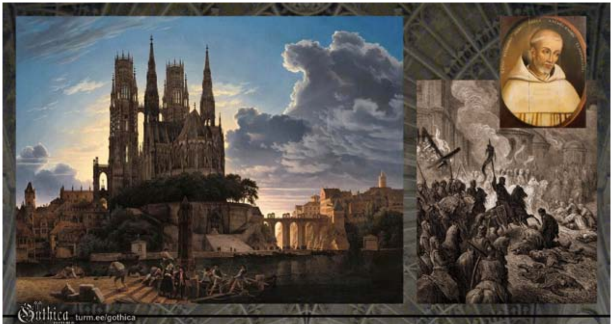
Pildil: Karl Friedrich Schinkel „Keskaegne linn vee ääres“ (1813), Gustave Doré „Ristisõdijate sisenemine Konstantinoopolisse“ (1877), 12. sajandi ideoloog ning pühamees Clairvaux’ kloostris abt Bernard.