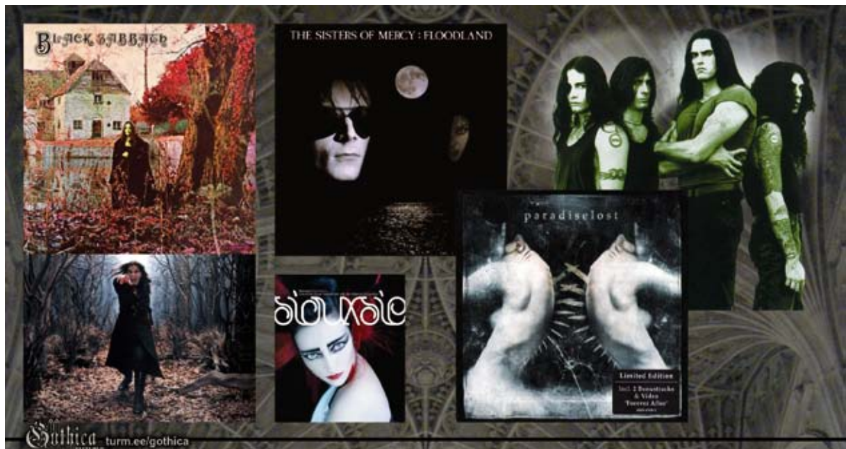
Pildil: Black Sabbathi albumi „Black Sabbath“ (1970) kaanepilt ja bändi laulja Ozzy Osbourne, The Sisters of Mercy „Floodland“ (1987), Siouxsie Sioux „Dreamshow“ (2005), Paradise Lost „Paradise Lost“ (2005), bändi Type O Negative liikmed.