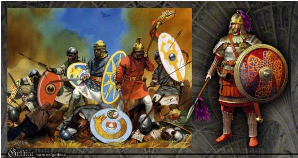
Pildil: Läänegootid Adrianoopoli lahingus 378. aastal (autor: Angus McBride), Konstantinoopoli keisri teenistuses olev idagootide sõdalane.