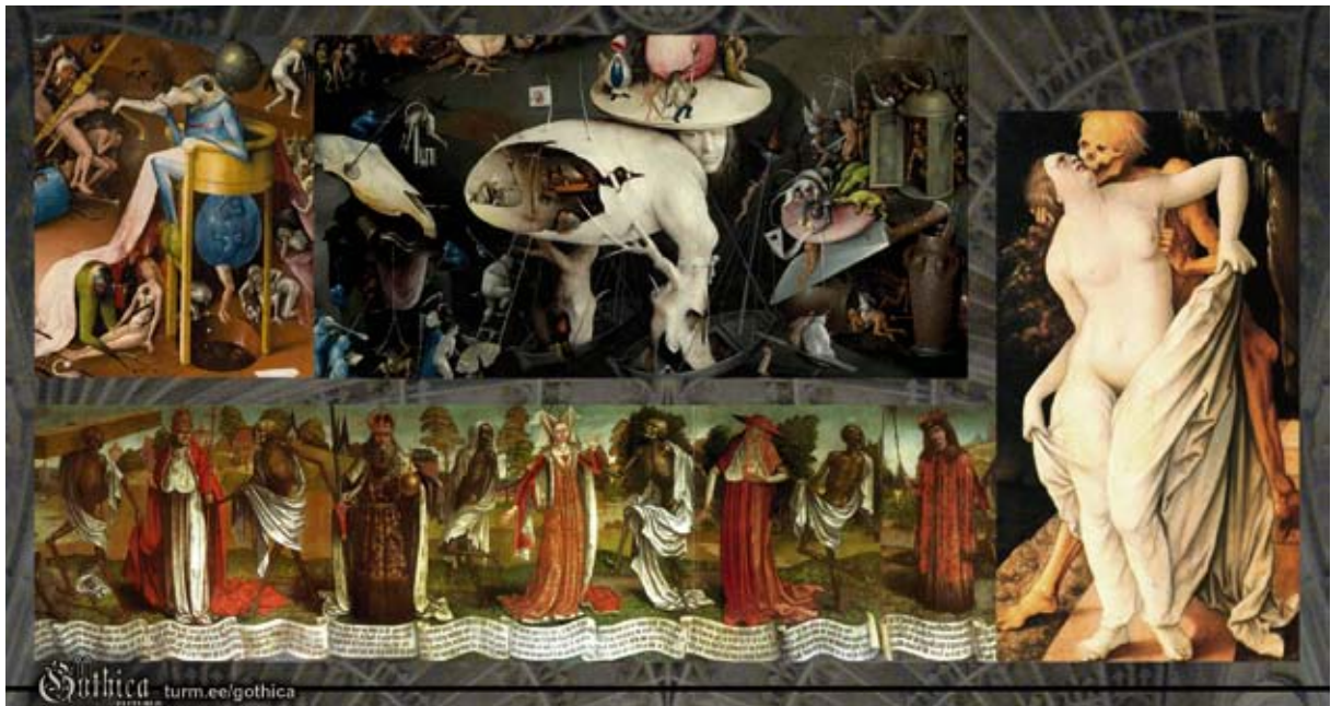
Pildid: Detailid Hieronymus Boschi maalist „Lõbude aed“ (16. saj), Bernt Notke „Tallinna Surmatants“ (15. saj), Hans Baldung Grien „Naine ja Surm“ (16. saj).